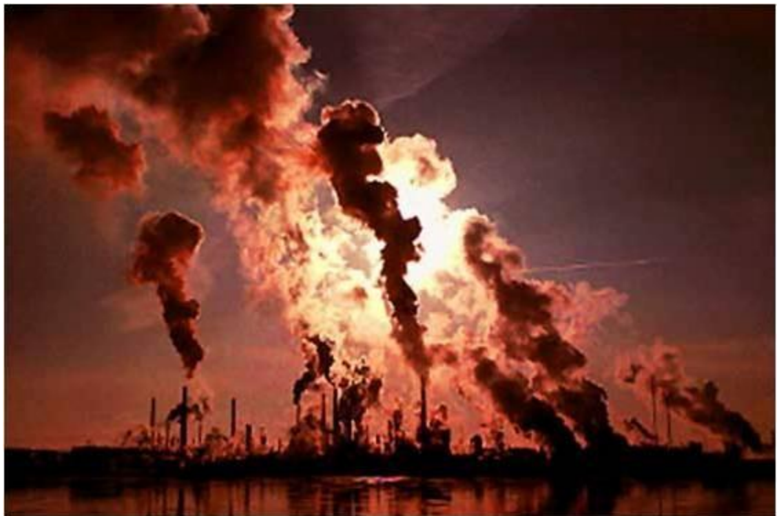
CONTAMINACIÓN DEL AIRE POR FABRICAS