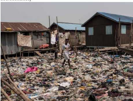
Contaminación en un pueblo.

Los últimos tres siglos el modelo económico se ha centrado en el dominio y explotación de la naturaleza, que se ha mostrado insostenible tanto ambiental como socialmente. Si seguimos así seguramente moriremos como especie. Una parte importante de la región se ha degradado como resultado de cambios en el uso de la tierra de ecosistemas naturales agricultura, industria, turismo, petróleo, minería y asentamientos humanos. Los combustibles fósiles proporcionan el 85% de las necesidades energéticas del país. Debido a que dependemos de la energía, estamos en peligro a causa de al agotamiento de estos recursos. La política energética fomenta la exploración de nuevas fuentes mediante procedimientos que tienen consecuencias ambientales y sociales, como el fracking. México es uno de los países más vulnerables al cambio climático. Hay una disminución de las precipitaciones y un aumento del nivel del mar, lo que provoca un aumento de las inundaciones. Tienen repercusiones en el sector pesquero, forestal, agrícola, ganadero y turístico y en la salud humana,