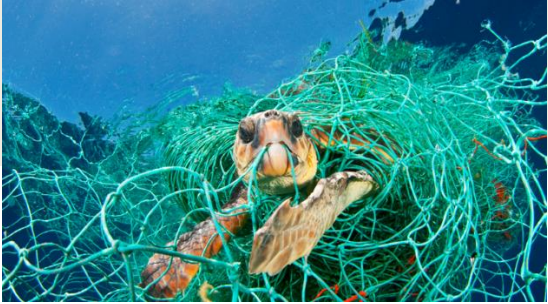
TORTUGA MARINA ATRAPADA EN RED DE PESCA

EL SUBTÍTULO DESCRIPTIVO VA AQUÍ. PONGA LA ANCHURA MÁXIMA.